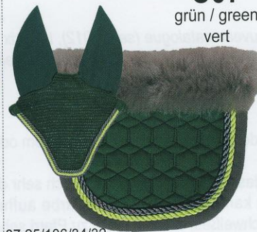
C07 grün / green vert