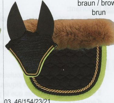
C03 braun / brown brun