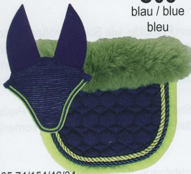
C05 blau / blue bleu