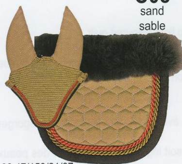
C08 sand sable