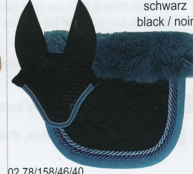
C02 schwarz black / noir