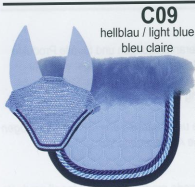
C09 hellblau / light blue bleu claire