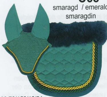
C68 smaragd / emerald smaragdin