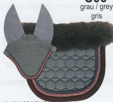
C06 grau / grey gris